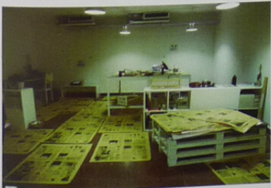
DIY 丝网印刷现场：编辑部也是印刷厂