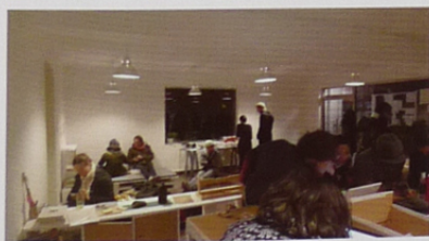
临时编辑部内大伙儿干得热火朝天